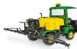
HD200 GPS PRECISIONSPRAY