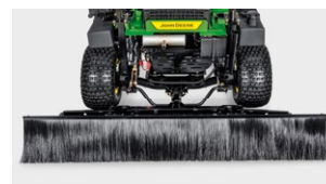
Am Heckrechen befestigte Bürste