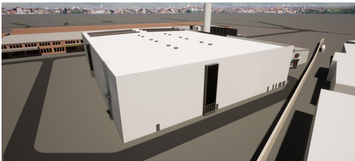
Entwurf der neuen Lackieranlage im John Deere Werk Mannheim.

Weitere Informationen finden Sie auf der Website unter folgendem Link: www.deere.de/lackieranlage .